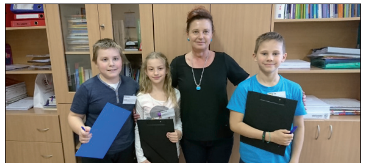
Wywiad przeprowadzili: Jan Wysiecki, Filip Hołubowicz, Zuzana Kado.

Pani Wicedyrektor: Dziękuję Wam bardzo. Ponieważ to nie jest tylko dzień nauczyciela, jak na pewno wiecie jest to Dzień Edukacji Narodowej, więc ja z tego miejsca życzę Wam i waszej Pani dużo zdrowia i wielu sukcesów, które będą Was cieszyły. Przekażcie moje życzenia wszystkim koleżankom i kolegom w klasie.